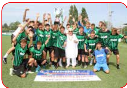
U.S. SASSUOLO 2022