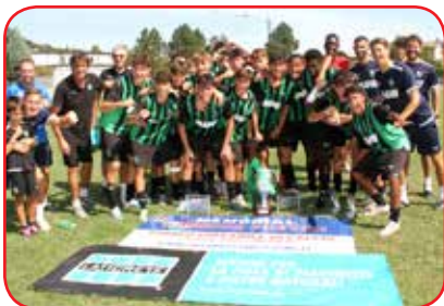
U.S. SASSUOLO 2023